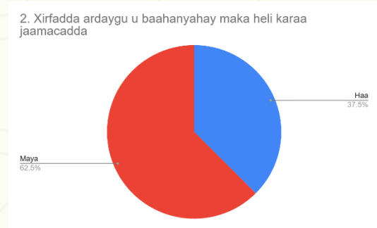
Figure 1: Jaantus-kaan waa pie chart muujinaya doorashada ka qaybgalayaasha.

kuwaas oo kala ah shahaado jaamacadeed, xirfad shaqo, iyo isku darka labadaba.