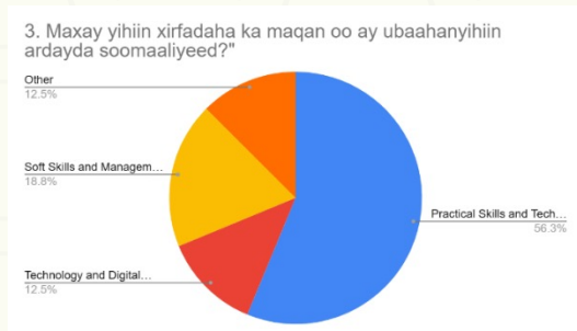
Figure 3: Jaantuskaan waa pie chart muujinaya noocyada xirfadaha

Su'aasha saddexaad ee xog aruurinta waxay ahayd: "Maxay yihiin xirfadaha ka maqan oo ay u baahanyihiin ardayda Soomaaliyeed?"